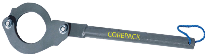
アウターチューブ用 インナーチューブ用もございます。